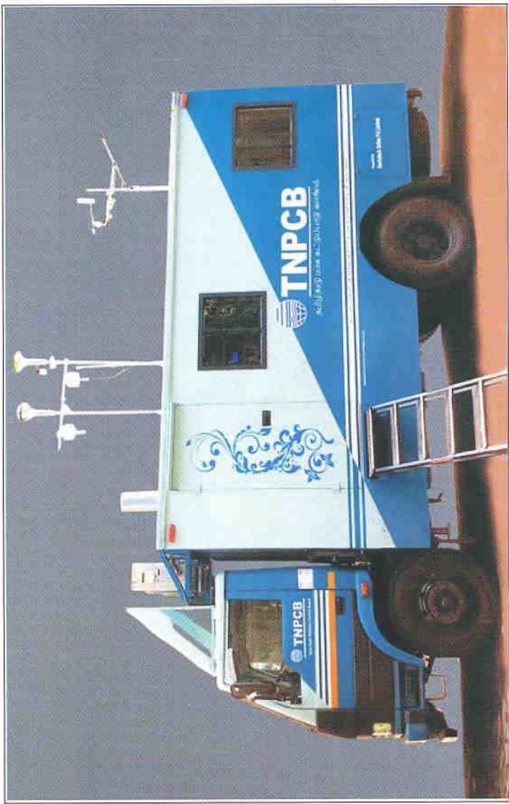
நடமாடும் தொடர் சுற்றுப்பற காற்று தர கண்காணிப்பு நிலையம்