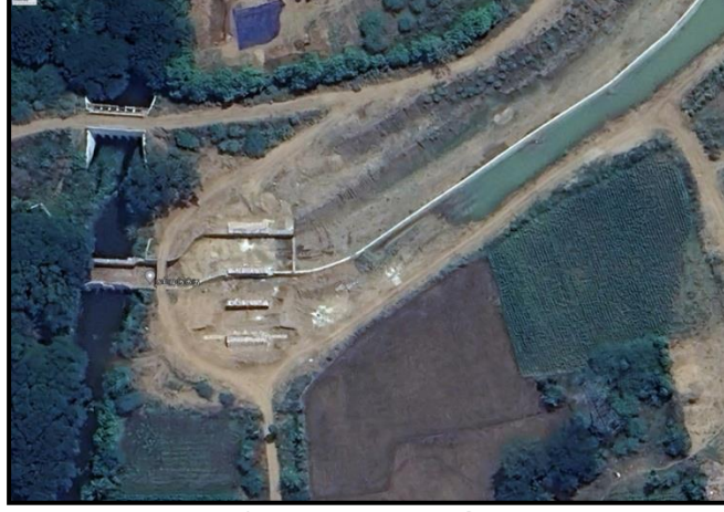
படம் எண்.1.3: வாய்க்காலின் மையத்தில் தடுப்புச் சுவரைக் கட்டி தற்போதுள்ள தெற்கு ராஜன் வாய்க்காலில் திருப்புதல்